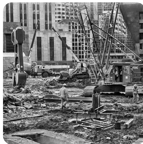
terremoto de 1985

Los jóvenes seguían la moda americana y también llevaban el pelo con mucho volumen y pintados con colores llamativos. También llevaban ropa de cuero, las mayas, las minifaldas y el maquillaje de colores. Solían llevar igualmente pulseras y collares de plástico.